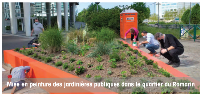
Mise en peinture des jardinières publiques dans le quartier du Romarin

Rendez-vous le samedi 25 septembre à 9h pour un atelier mobilier urbain .