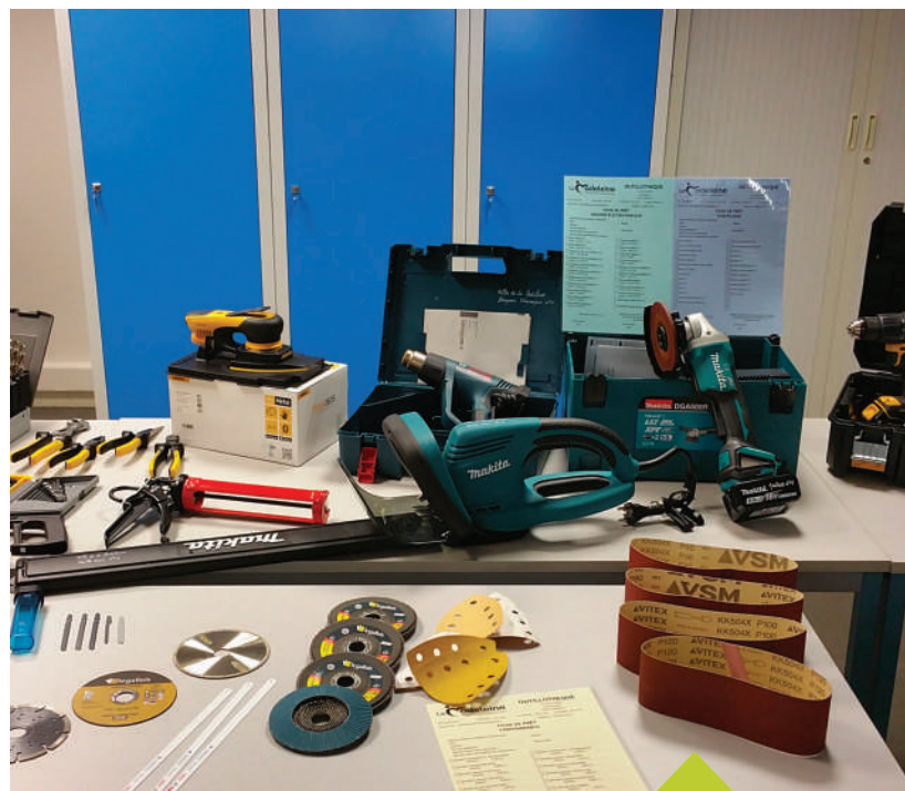
L'outillothèque municipale est installée sur la future ZAS au 8 rue Delesalle.

ou sur outillothèque@ville-lamadeleine.fr