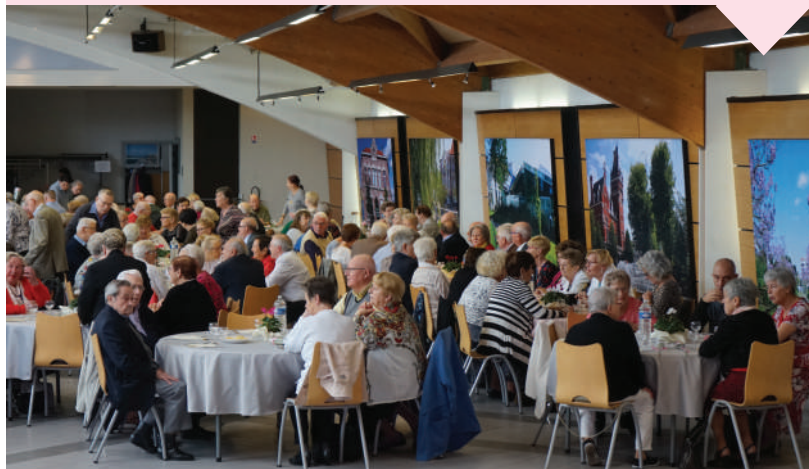
Photo prise avant la crise sanitaire d'un précédent repas des aînés

Les inscriptions se dérouleront en mairie du 20 au 24 septembre. Il est également possible de s'inscrire par téléphone en fournissant son numéro de carte pass'seniors.